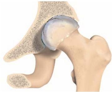
Tête fémorale usée

La hanche est soumise, au quotidien, à de nombreuses contraintes : elle supporte le haut du corps, s'articule à chacun de nos pas et absorbe les pressions causées par la plupart de nos mouvements. Peu à peu, la couche de cartilage s'use et l'arthrose apparaît. Cela provoque des douleurs plus ou moins intenses qui, autrefois, pouvaient conduire à la perte totale de la mobilité. Aujourd'hui, les progrès de la médecine et des techniques chirurgicales permettent de remplacer la hanche malade par une articulation artificielle : la prothèse.