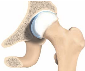
Tête fémorale saine